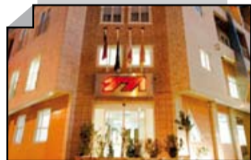
CONFLITO NA TEODORO ALHO CHEGA AO PARLAMENTO PÁG.3