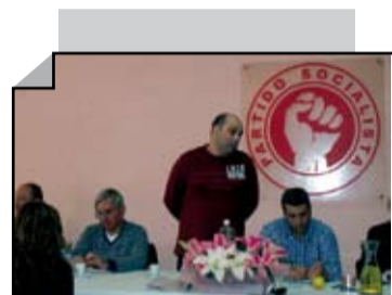
FAMÍLIA SOCIALISTA DA QTA DO CONDE EM ALMOÇO DE PÁSCOA PÁG. 4

Director: Jorge Henriques Santos • 31 de Março de 2010 • EDIÇÃO 385 • Distribuição Gratuita